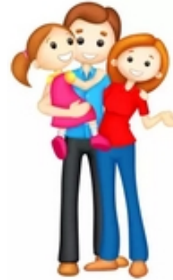
Progressivité de la taxe pour dépassement

C'est l'administration fiscale qui gère l'ensemble du dispositif